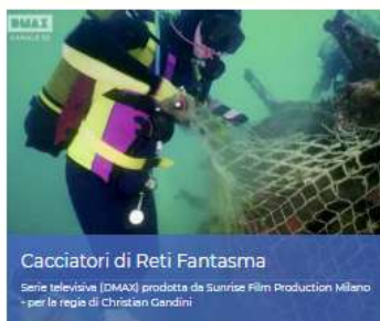
Cacciatori di Reti Fantasma

Membro della Commissione oceanografica Unesco