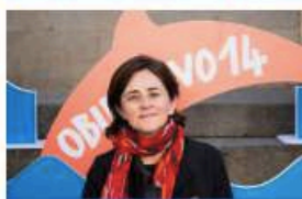
Francesca Santoro Membro della Commissione geografica Unesco