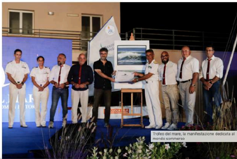
Trofeo del mare, la manifestazione dedicata al mondo sommerso