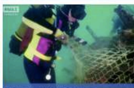
Cacciatori di Reti Fantasma

serie televisiva (DRAK) prodotta da Lumina Film Production Milano con la regia di Christian Davalli