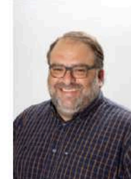
Ragusa, 18 agosto 2022